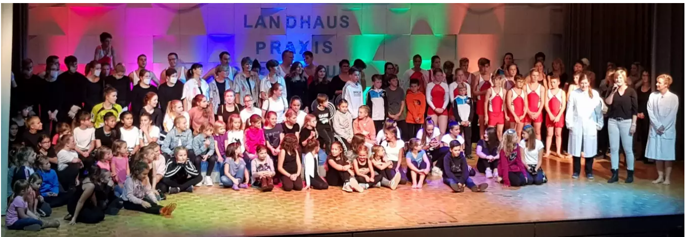
Der TV Steffisburg

Zum Amt der Präsidentin kam ich durch verschiedene andere Funktionen im TV Steffisburg. So war ich seit 2008 für das Sekretariat tätig und habe die Webseite bewirtschaftet. Als mein Vorgänger 2017 zurücktrat formte sich eine Arbeitsgruppe.