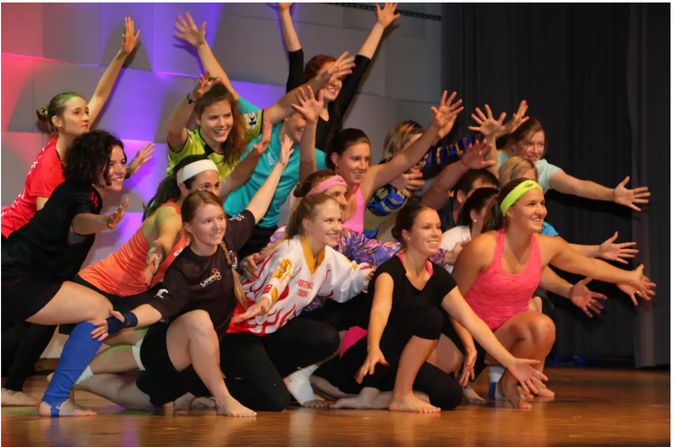
Die Gymnastikriege des TV Steffisburg

Ob und in welcher Form wir vor den Sommerferien noch trainieren können, steht zum heutigen Zeitpunkt in den Sternen.