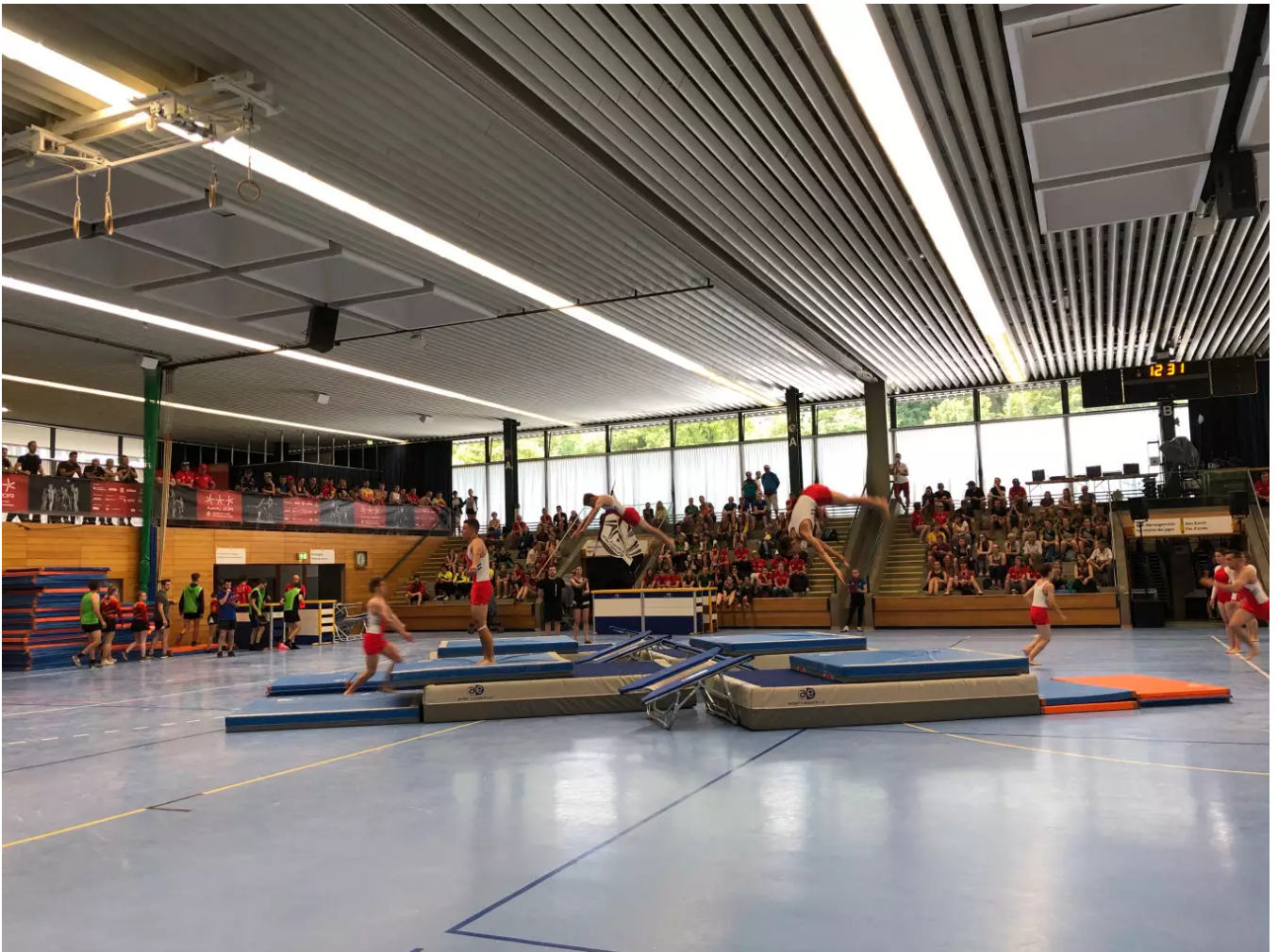
Die Sprunggruppe in Aktion

Dann steht Mitte November unser Unterhaltungsabend an, dieser ist eine wichtige Einnahmequelle für uns. Wir werden an der Vorstandssitzung diskutieren müssen, ob und wie dieser stattfinden kann.